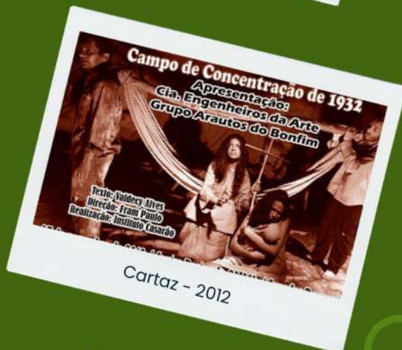
Cartaz - 2012