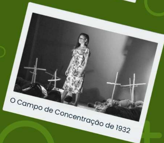
O Campo de Concentração de 1932