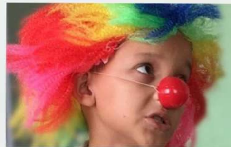
Auto de Maria Santa - 2019