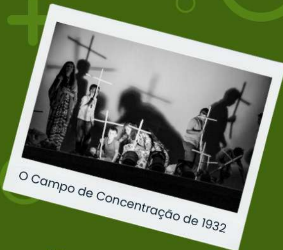
O Campo de Concentração de 1932