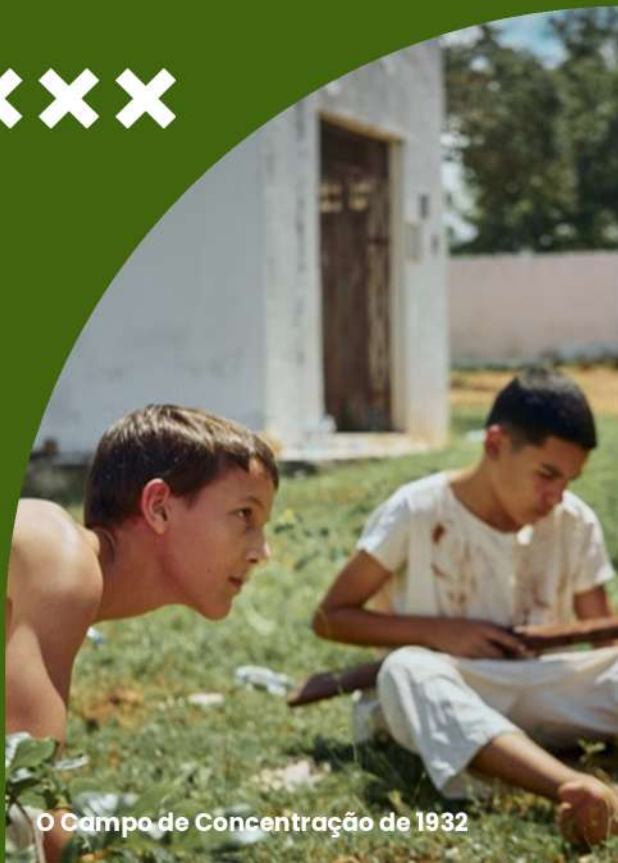
O Campo de Concentração de 1932