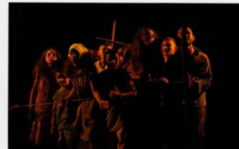
O Campo de Concentração de 1932 2013