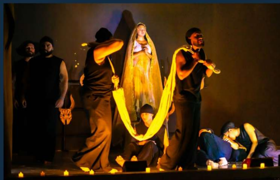
Apresentação no Evento Semana Cultural da Caminhada da Seca em Senador Pompeu-CE. Novembro de 2025.