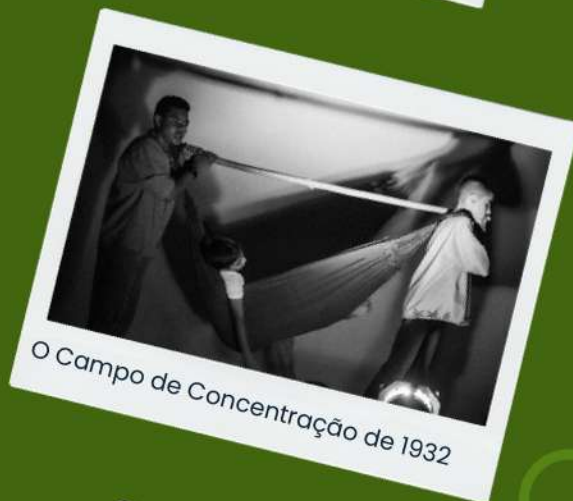
O Campo de Concentração de 1932