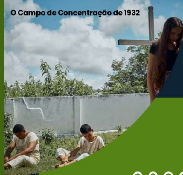
O Campo de Concentração de 1932