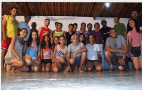
Oficina de dança - 2010