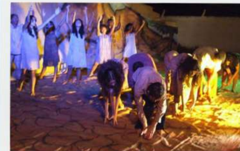
O Campo de Concentração de 1932 2010