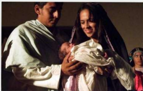
Auto de Maria Santa - 2012