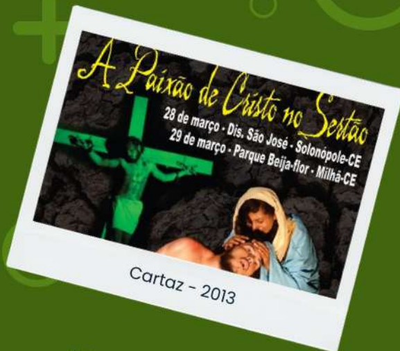
Cartaz - 2013