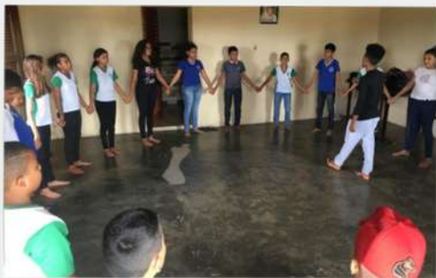
Oficina de teatro - 2019