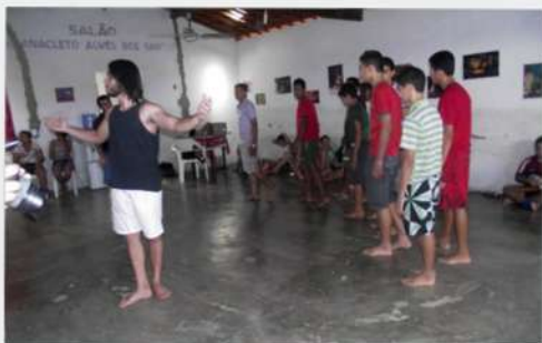
Ensaio - 2012