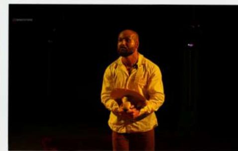
O Campo de Concentração de 1932 2021