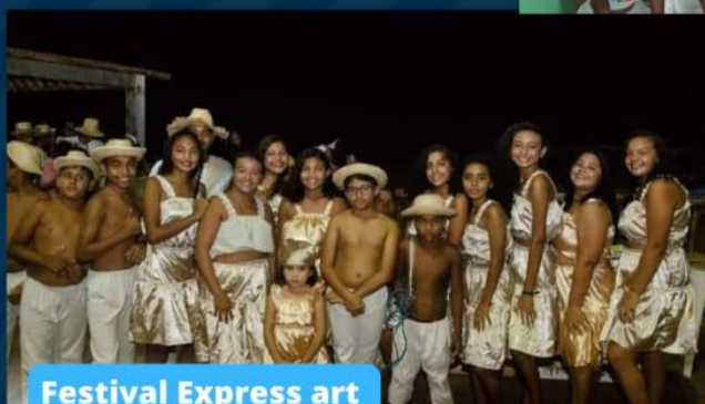
Festival Express art