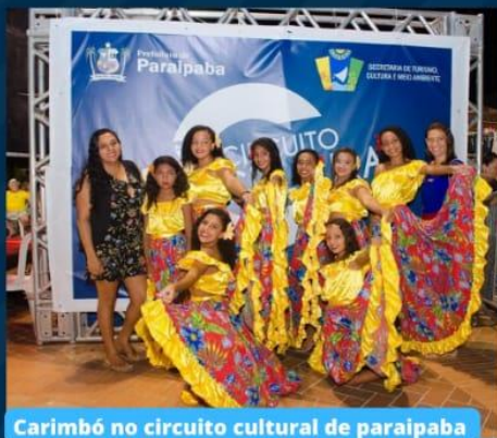
Carimbó no circuito cultural de paraipaba