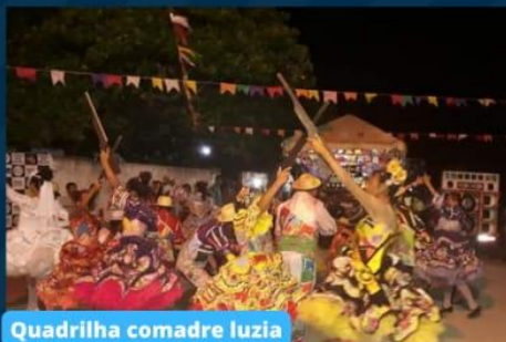
Quadrilha comadre luzia