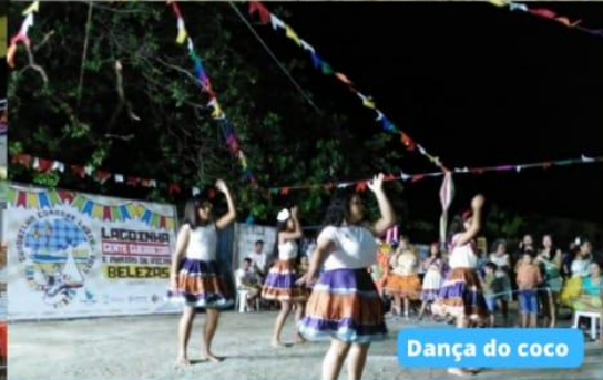
Dança do coco