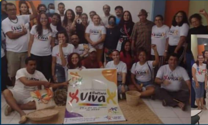
REDE CEARENSE CULTURA VIVA