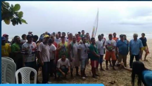
Comemoração dos Pescadores