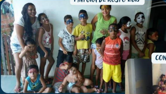
PINTURA DE ROSTO 2015