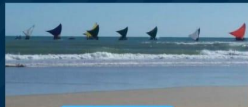
Velejo pelo o mar