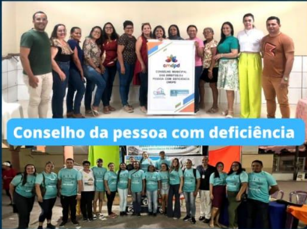
Conselho da pessoa com deficiência