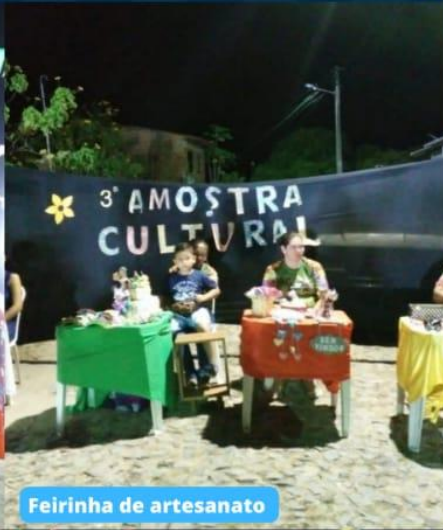
Feirinha de artesanato