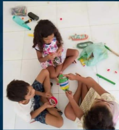
Briquetes bilboquê e vai e vem..