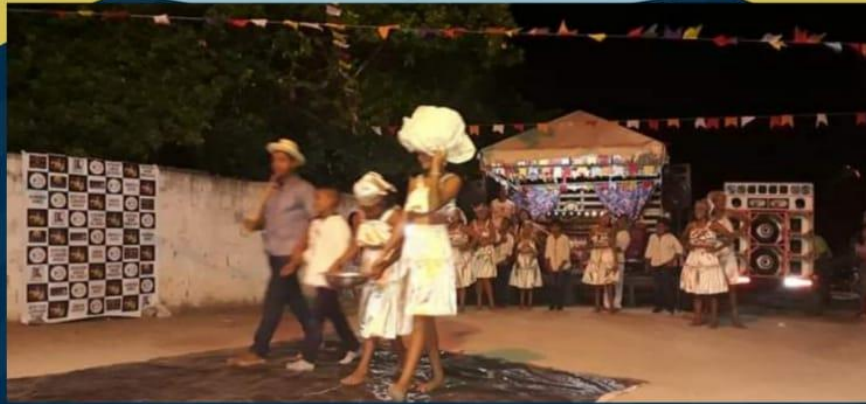
Espectáculo vidas secas de Ariano Suassuna