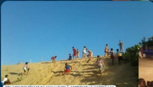
BRINCADEIRAS TÍPICAS DA COMUNIDADE "CARRETEAR NO MORRO" 2018