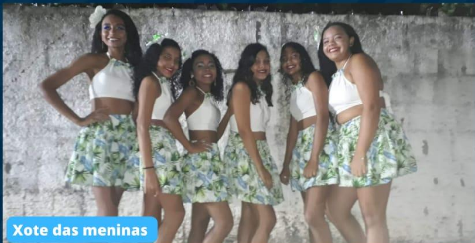
Xote das meninas