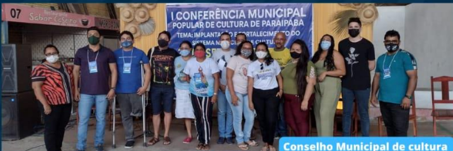
Conselho Municipal de cultura