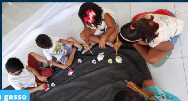
Pintura em gesso