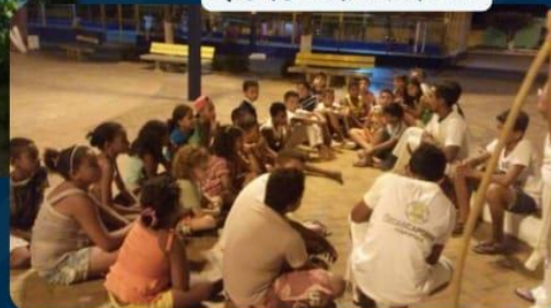
RODA DE CAPOEIRA 2019