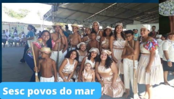
Sesc povos do mar