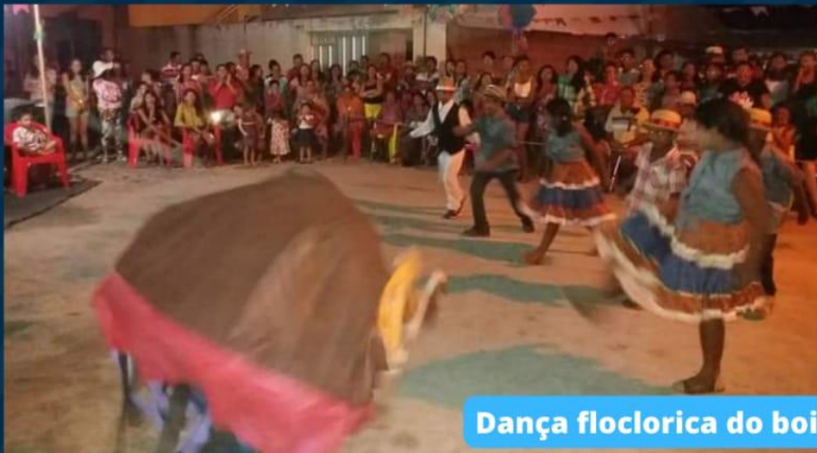
Dança floclorica do boi