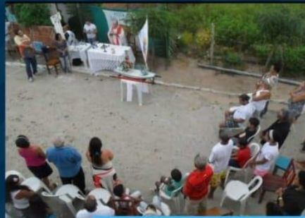
Momento de bênção para os Pescadores