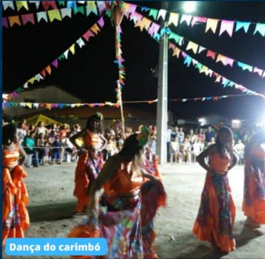
Dança do carimbó